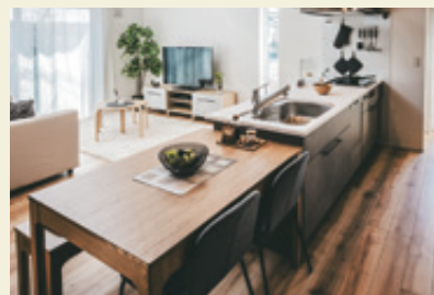
DINING KITCHEN ダイニングキッチン

明るく、機能的に。家事動線にも配慮しました。 システムキッチンがタカラスタANDARD製です。