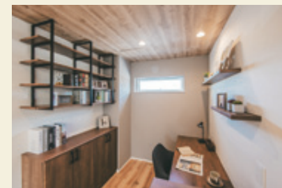
WORK SPACE ワークスペース

明るく、機能的に。家事動線にも配慮しました。 システムキッチンがタカラスタANDARD製です。